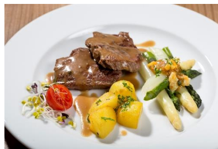
Health Catering