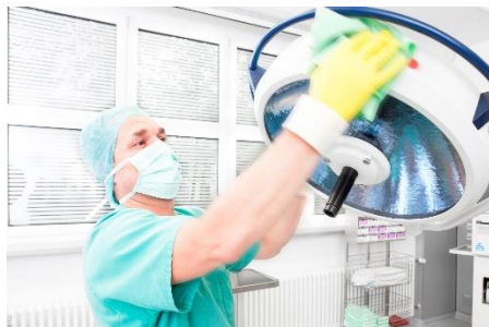
Healtcare Hygienereinigung OP-Saal