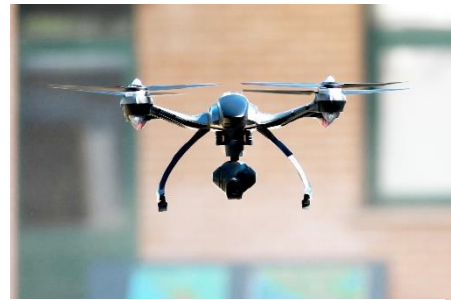
Drohnen im Sicherheitsdienst