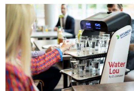
Serviceroboter Water Lou