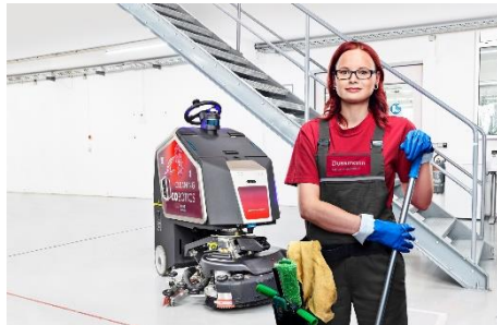
Cobotics in der Unterhaltsreinigung