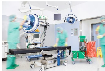
Healtcare Hygienereinigung OP-Saal